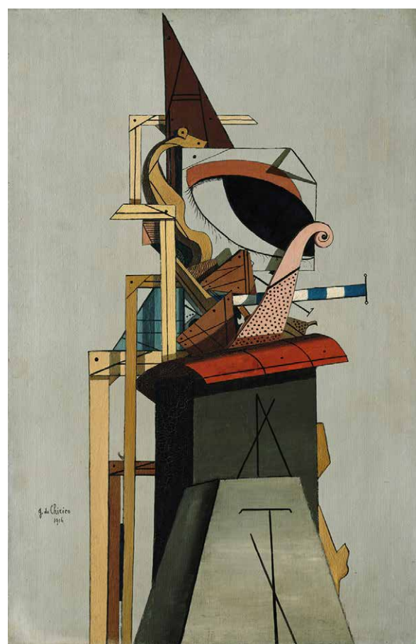
Fig. 5: Giorgio de Chirico, L'angelo ebreo , 1916 Olio su tela, cm 67,5 x 43,8 New York, The Metropolitan Museum of Art, Jacques and Natasha Gelman Collection, 1998