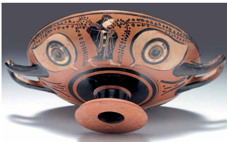
Fig. 2: Kylix attica ad occhioni, fine VI sec. a.C. Alt. 8.5 cm, diam. 21.5 cm. Ceramica attica a figure nere