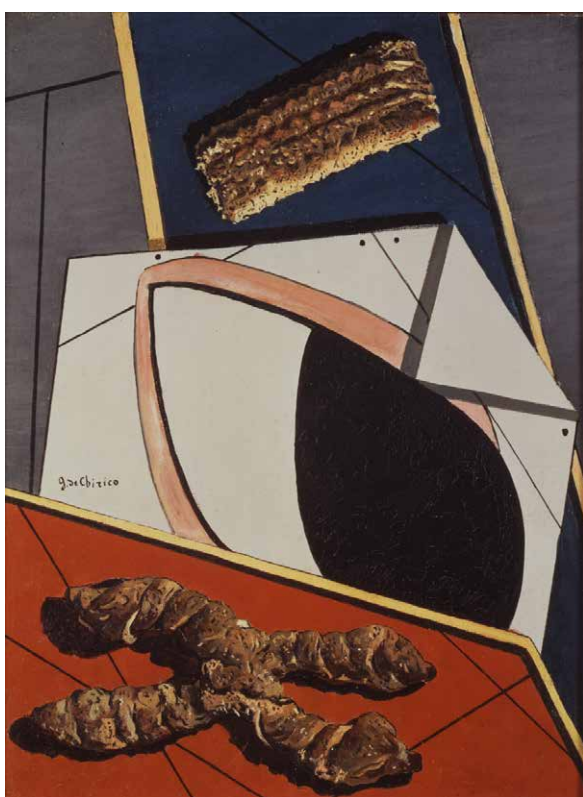
Fig. 4: Giorgio de Chirico, Il saluto dell'amico lontano , 1916. Olio su tela, cm 48,2 x 36,5. Collezione privata

L'occhio è protagonista dell'opera Oggetto indistruttibile di Man Ray del 1923 (6). Il suo significato può essere spiegato attraverso le parole stesse dell'artista: "Ritagliare l'occhio dalla fotografia di una persona amata, fissare l'occhio al pendolo di un metronomo e regolare il peso in modo da ottenere il ritmo desiderato, continuate fino al limite della sopportazione. Con un martello ben assestato cercare di distruggere il tutto con un solo colpo". Con l'ironia tipica del movimento dadaista e comune alla metafisica, l'artista presenta come opera d'arte l'accostamento insolito di un ritaglio fotografico e di un metronomo; conclude però con una nota iconoclasta (la distruzione dell'opera) assente nella poetica dechirichiana.