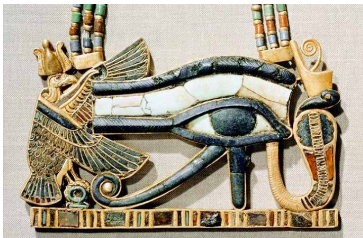
Fig. 1: Udjat, occhio di Horus, ritrovato nel tesoro di Tutankhamen. Parte di un pettorale in oro, pietre preziose e pasta vitrea

L'occhio come simbolo massonico aveva la medesima finalità, ovvero di respingere la cattiva sorte. Inoltre rappresentava la provvidenza come onniscienza e onnipresenza divina.